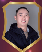
安装约克郡五期 黄练