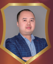
荣盛华府项目 乐荣飞