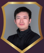
龙湖中央公园二期 张枫