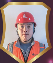
昆明招商雍华府花园 孟磊