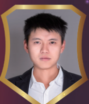
怡置悦祥礼嘉 吴江