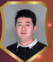
龙湖礼嘉天街 成健