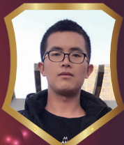
昆明中南樾府花园 庄彦