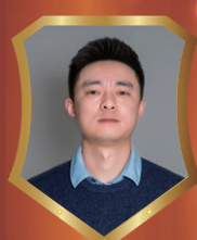
万科照母山项目 江毅