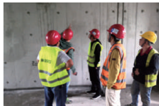
混凝土强度专项排查现场照片