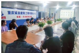
成都龙湖大天路项目“质量月”动员会现场

结构混凝土强度专项排查，搜集实测数据，并对数据进行全面分析，最终形成专项检查报告；四、开展“质量月”专题培训及考试，培训内容充实，课堂氛围活跃，得到了参训员工的一致好评，通过本次专题培训及考试，提高了参训人员质量管理水平；五、开展“质量月”总结，通过复盘，聚焦质量风险管控从风险隐患整改向风险隐患预控转变，同时针对质量管理颁布项目管理办法。