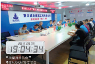
眉州文化村皓江项目“质量月”动员会现场