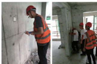
混凝土强度等专项排查现场照片