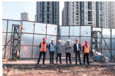
万科重庆总经理现场视察