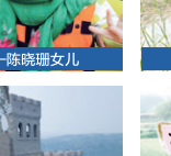
礼嘉核心区——白华文儿子