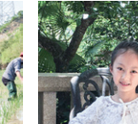
成控一部——康静女儿