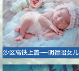
沙区高铁上盖——明德昭女儿