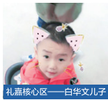
礼嘉核心区——白华文儿子